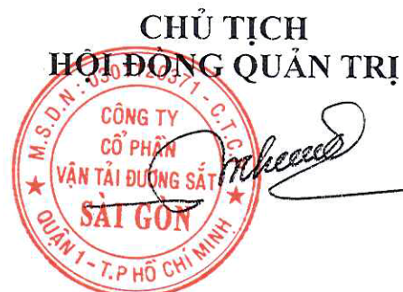
Nguyễn Đức Nhân

- Thông báo số 442/TB-HĐQT ngày 05/4/2019 v/v mời họp ĐHĐCĐ thường niên 2019 và chi trả cổ tức năm 2017;