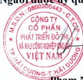
Phạm Ngọc Thảo