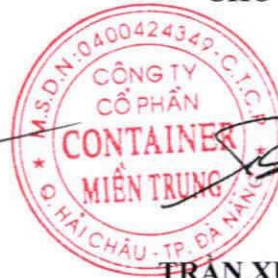
TRẦN XUÂN BẠO