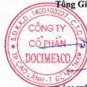
TRẦN HỮU HIỆP