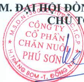
Phùng Khôi Phục