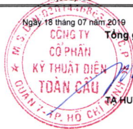
TÀ HUY PHONG