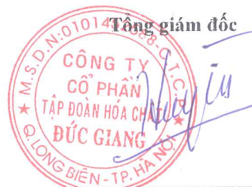
Đào Hữu Huyền