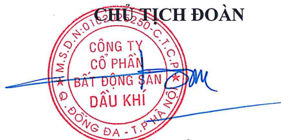
Thân Thế Sơn