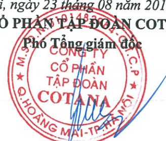
Trần Trọng Đại