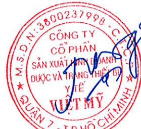
Đặng Nhị Nương