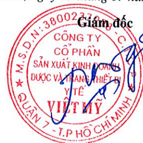
Đặng Nhị Nương