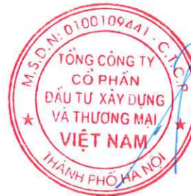
Trần Anh Hải

CV số: 143/2019/BC-CTX ngày 12/09/2019 báo cáo kết quả phát hành cổ phiếu để tăng vốn cổ phần từ nguồn vốn chủ sở hữu.