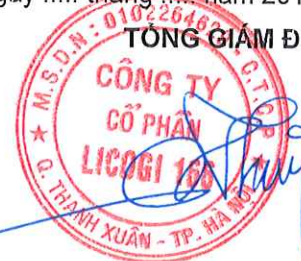
Vũ Công Hưng