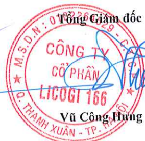
Vũ Công Hưng