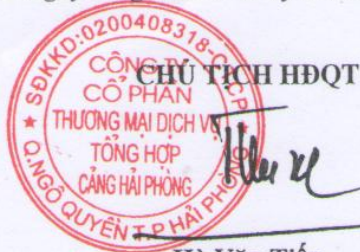
Hà Văn Tiến

Cuộc họp kết thúc vào hồi 11h00' cùng ngày. Biên bản được thông qua các thành viên Hội đồng quản trị Công ty cùng nhất trí và ký tên dưới đây: