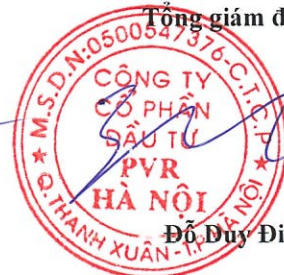
Đỗ Duy Điền