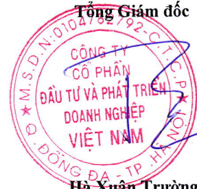
Hà Xuân Trường