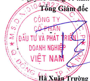
Hà Xuân Trường