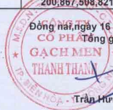
Trần Hưng Lương