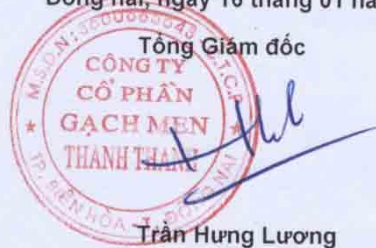
Trần Hưng Lương