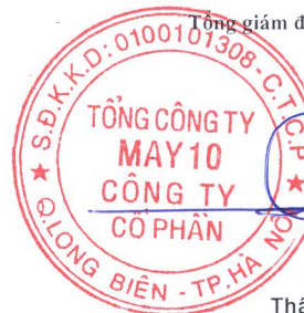
Thân Đức Việt