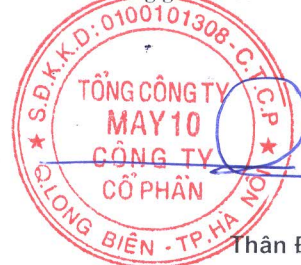
Thân Đức Việt