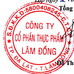
Đỗ Thành Trung