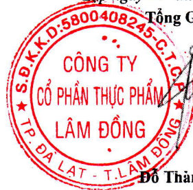
Đỗ Thành Trung