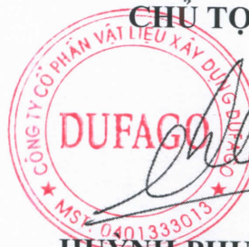
HUYNH PHƯỚC HUYỀN VY