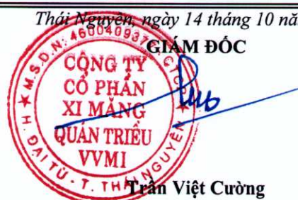
Trần Việt Cường