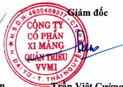
Trần Việt Cường