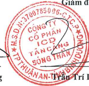
Trần Trí Dũng