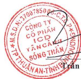
Trần Trí Dũng