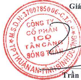
Trần Trí Dũng