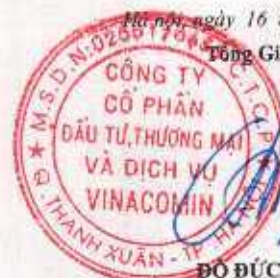
ĐỖ ĐỨC TRỊNH