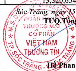
Hồ Phan Hải Triều