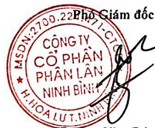
Đương Như Đức