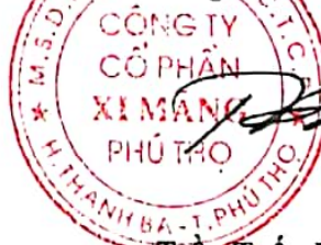
Trần Tuấn Đạt