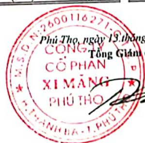
Trần Tuấn Đạt