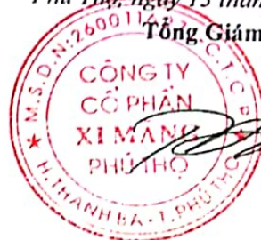
Trần Tuấn Đạt