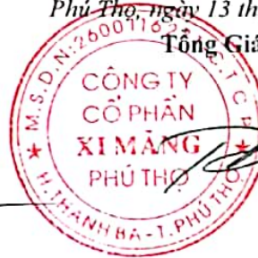
Trần Tuấn Đạt