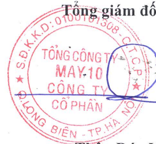
Thân Đức Việt