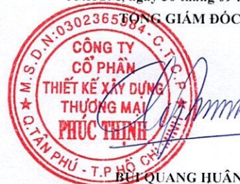
BUI QUANG HUÂN