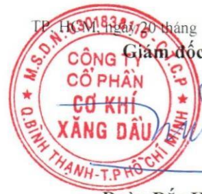
Đoàn Đắc Học