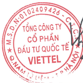
Chủ tịch HĐQT