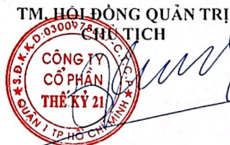
TRẦN THẺ VINH