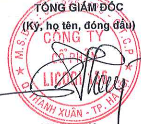
Vũ Công Hưng