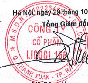
Vũ Công Hưng