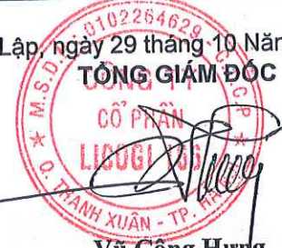
Vũ Công Hưng