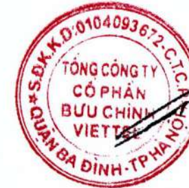
Trần Trung Hưng