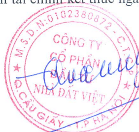
Trần Quốc Huy Chủ tịch HĐQT