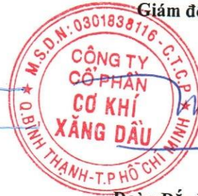
Đoàn Đắc Học