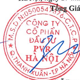
Đỗ Duy Điền