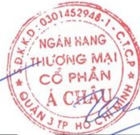
Trần Hùng Huy Chủ tịch Hội đồng Quản trị Ngày 29 tháng 2 năm 2020