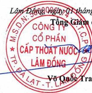
Võ Quốc Trang