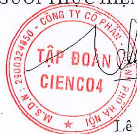
Lê Đức Thọ