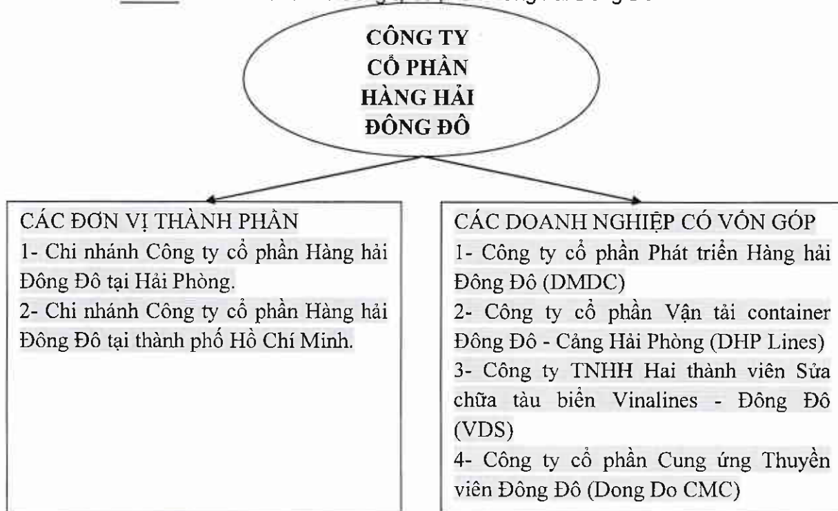
Hình 1 - Cơ cấu tổ chức Công ty cổ phần Hàng hải Đông Đô

Vốn điều lệ: 3,5 tỷ đồng, trong đó Công ty cổ phần Hàng hải Đông Đô góp 2,52 tỷ đồng tương ứng 72% vốn điều lệ.