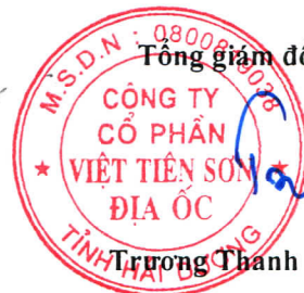
Trương Thành Sơn