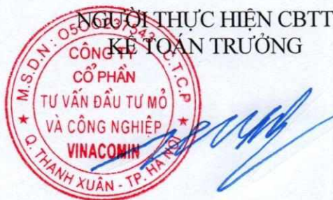
Phùng Đức Trường