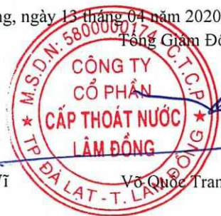
Võ Quốc Trang