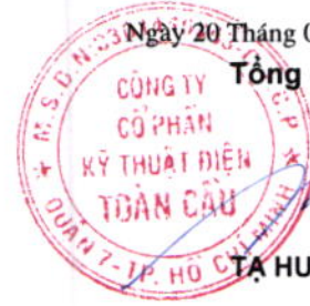
TẠ HUY PHONG