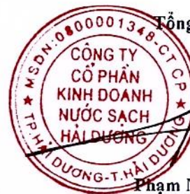
Phạm Minh Cường

(Các thuyết minh từ trang 6 đến trang 27 là bộ phận hợp thành của Báo cáo tài chính giữa niên độ này)