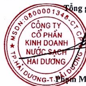
Phạm Minh Cường

(Các thuyết minh từ trang 6 đến trang 27 là bộ phận hợp thành của Báo cáo tài chính giữa niên độ này)