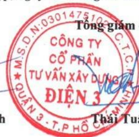
Thái Tuấn Tài