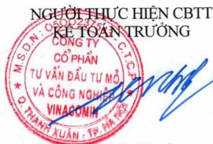
Phùng Đức Trường