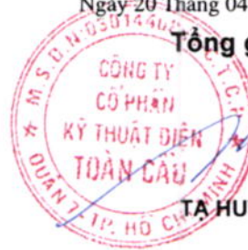
TẠ HUY PHONG