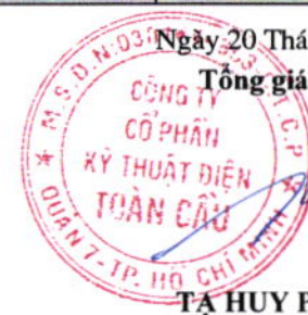
TẠ HUY PHONG