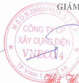
Hồ Hữu Phước