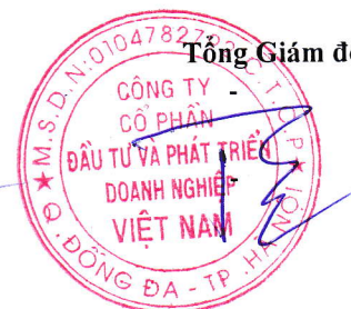
Hà Xuân Trường