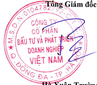
Hà Xuân Trường