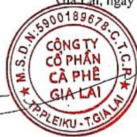
TRỊNH ĐÌNH TRƯỜNG